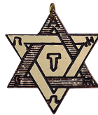
Salomos Siegel 22