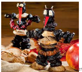
Pflamentoffel ( Teufel ) (Deutschland, Österreich)

„Im Sakralen liegt daher zunächst keine Garantie für Dauer, für Verehrung, für Tradition, und wenn es zur Tradition wird, ist dies schon der erste Schritt zur Auflösung seiner Sakralität .“ 26 – schreibt Luhmann.