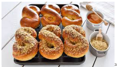
Mucenici (Rumänien und Rep. Moldau)

tes%2Fdefault%2Ffiles%2Fstyles%2Farticle-image-big%2Fpublic%2Fbrioche_krampus6.jpg&imgrefurl=https%3A%2F%2Fwww.haubis.com%2Fit%2Fnode%2F961&docid=cAzyZftz1xivAM&tbnid=cILQNI7iup5FyM%3A&vet=10ahUKEwiW1KrVls3XAhVlApoKHUf2ANc4ZBAzCD4oOzA7..i&w=651&h=407&itg=1&bih=805&biw=1440&q=Krampuskuchen&ved=0ahUKEwiW1KrVls3XAhVlApoKHUf2ANc4ZBAzCD4oOzA7&iact=mrc&uact=8