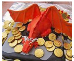
Liebe Sünde, Schokoladenkuchen