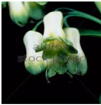
Salomos Siegel 21