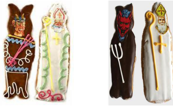
Lebkuchen Krampus und Nikolaus 20