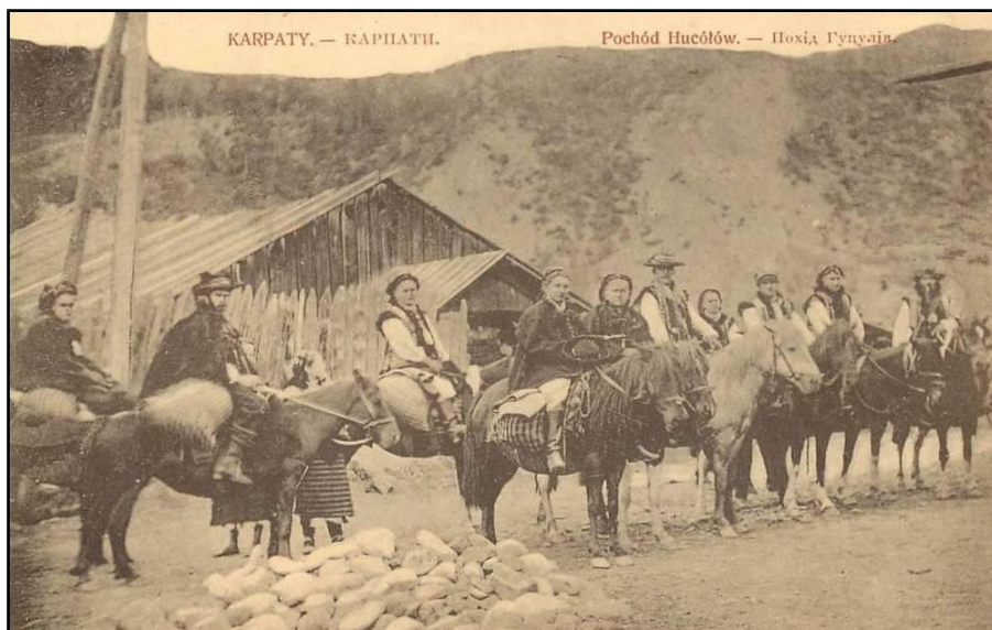
4) Huțuli din Regiunea Subcarpathia , Ilustrată etnografică editată la Praga, cca 1900.