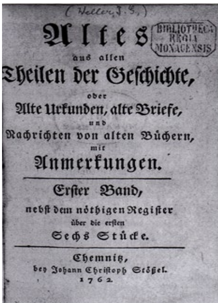
Abb. 3 Titelblatt: Johann Gottfried Weller (edit.), Altes aus allen Theilen der Geschichte, oder Alte Urkunden [...], Chemnitz, 1762.