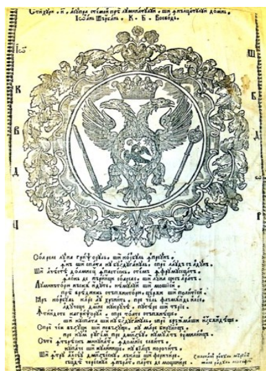
Abb. 6 Wappen des Woiwoden aus der Bukarester Bibel von 1688.