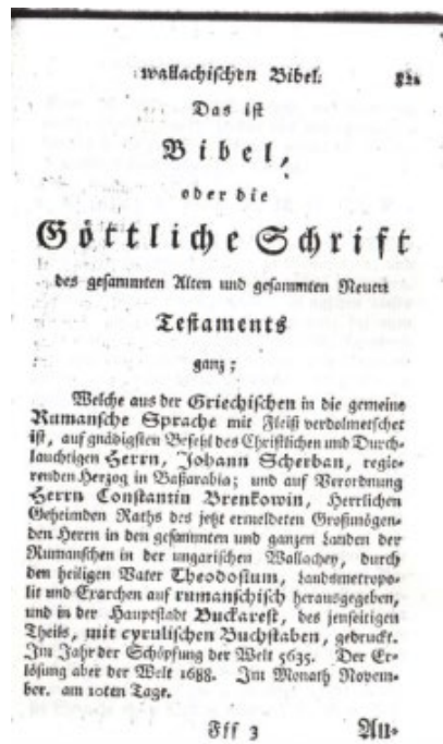
Abb. 4 Körners Transkription des Titelblatts der Bukarester Bibel von 1688.