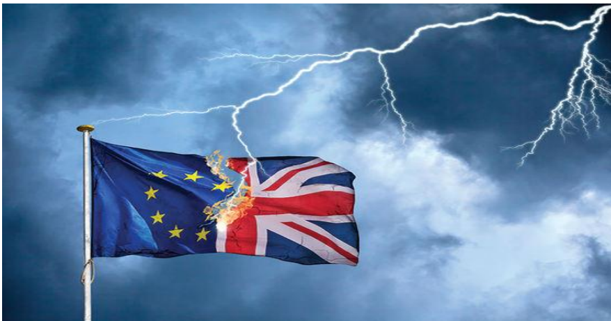
Fig. 4.