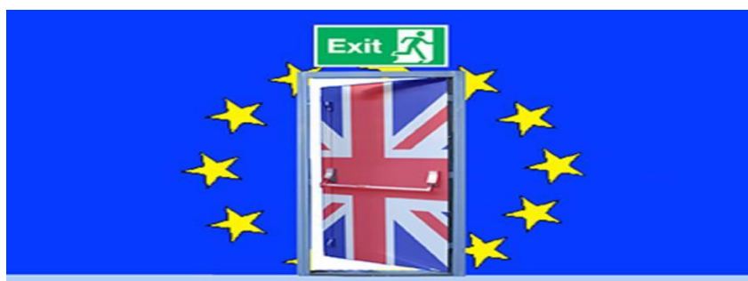
Fig. 2.

O definiție controversată care s-a impus în discursul media a fost lansată prin formularea tautologică celebră prin care Theresa May și-a început campania de a deveni prim-ministru: „Brexit înseamnă Brexit” („Brexit means Brexit”). Surprinzător este că această definiție tautologică a contribuit la câștigarea adeziunii deputaților conservatori în anul 2016. Explicația poate fi dedusă printr-o analiză la nivel pragmasemantic a acestui clișeu golit de conținut, ce permite o resemantizare în funcție de interesele interpretanților și relevă astfel „maleabilitatea conceptului” (Adler-Nissen et al 2017: 573).