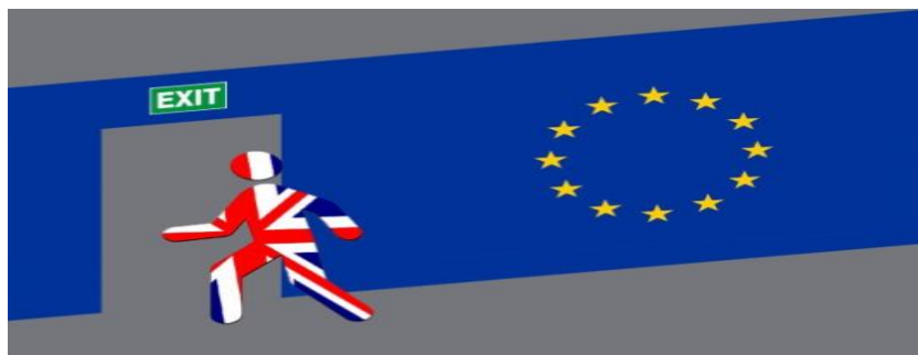
Fig. 1. Sursă: https://medium.com .

Axat pe metafora ieșirii, termenul traduce în subsidiar ideea că Marea Britanie poate părăsi Uniunea Europeană simplu, evocând, la nivel mental, imaginea simbolică a părăsirii unei clădiri trecând printr-o ușă (foarte des conceptualizată la nivel iconic în discursul online ).