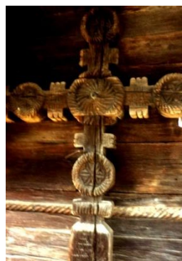
Foto 18: Detaliu. Funie răsucită de jur împrejurul bisericii Arhanghelii Mihail și Gavril, Rogoz, Țara Lăpușului, 2019.