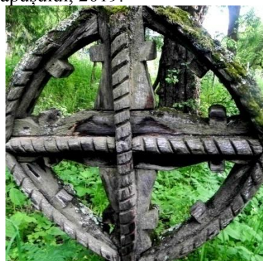
Foto 20: Detaliu. Torsada pe cruce celtică, Breb, Țara Maramureșului, 2019.