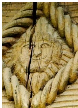
Foto 3: Simbol antropomorf inserat în romb, Hoteni – Țara Maramureșului, 2019.