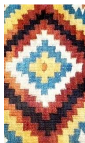
Foto 13: Detaliu pe șol/covor. Romb în trepte, Colecția Muzeului de Etnografie din Sighetu Marmației, Maramureșul Voievodal, 2019.