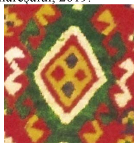
Foto 14: Detaliu pe șol/covor. Romb cu coarne Colecția Muzeului de Etnografie din de la Ieud, Maramureșul Voievodal, 2019.