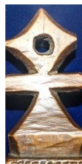
Foto 8: Romb stilizat pe pecetar antropomorf, Colecția Muzeului de Etnografie din Sighetu Marmăției, Maramureșul Voievodal, 2019.