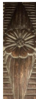
Foto 4: Simbol fitomorf inserat în romb, Breb – Țara Maramureșului, 2019.