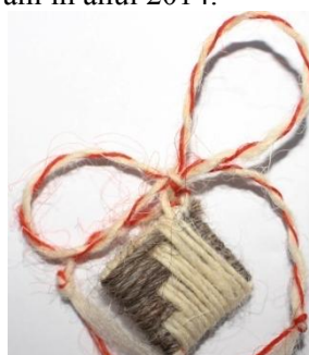
Foto 12: Mărțișor tradițional în formă de romb, Budești –Țara Maramureșului, 2019.