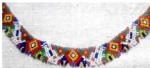
Foto 11: Romburi pe podoabă tradițională, Colecția Muzeului Județean de Etnografie și Artă Populară, Baia Mare, 2019.