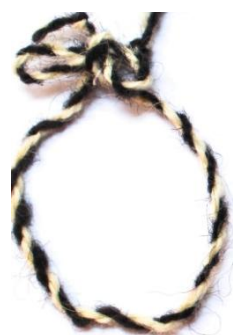
Foto 21: Funie răsucită, binaritatea alb-negru, Budești, Țara Maramureșului, 2019.