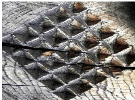
Foto 2: Romb cu fagure de miere , Bârsana, – Țara Maramureșului, 2019.