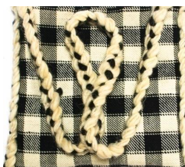
Foto 22: Detaliu. Funie răsucită, binaritatea alb-negru, Budești, Țara Maramureșului, 2019.