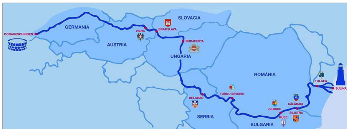
Figura 1. Dunărea europeană.

Dunărea, după cum s-a menționat, s-a format acum câteva milioane de ani, când s-au eliberat de ape și au ieșit la suprafață munții Carpați și când s-au retras din spațiile intramontane mările Badeniană, Sarmatiană, Meoțiană și Pontiană. În Cuaternar și-a făcut apariția în regiunile noastre omul. Într-un târziu, omul a dat nume obiectelor geografice din mediul ambiant, munților, râurilor, dealurilor, văilor etc. Cum se va fi numit inițial însuși fluviul, bineînțeles, nu se știe.