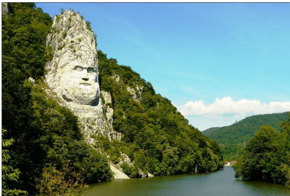
Figura 3. Dunărea la Cazane.

suprafața – 2,6 km 2 ), Congaz (1961, suprafața – 5,07 km 2 ), Taraclia (1988, suprafața – 15,1 km 2 ). Hidronimul a fost explicat prin cuman. jalpy „(râu, lac) în față, neadânc”.