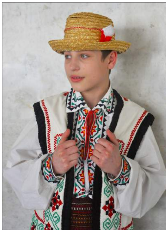
Mărțișorul, inclus de UNESCO în Lista reprezentativă a patrimoniului cultural imaterial al umanității.