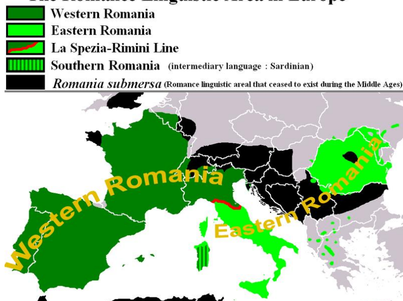
Figura 1: Area linguistica romanza in Europa 6 The Romance Linguistic Area in Europe

Una differenza linguistica si fa a livello dialettale, dove nell'attuale Romania parliamo in gran parte del dialetto dacoromeno, 7 mentre l'Italia offre un panorama linguistico diversificato. Riguardo questo tipo di somiglianze, i teorici osservano che le varianti sud-danubiane (a volte in consenso con le favelle dacoromene dell'ovest e nord) presentano il più grande numero di assomiglianze del sud Italia. 8 Anche M. Bartoli, una delle figure illustri della linguistica italiana, situa il romeno insieme ai dialetti della costa Adriatica. 9 I suoi predecessori, A. Griera (1922), W. Wartburg (1936), J. Herman (1985) avvicinano il romeno ai dialetti italiani centro-meridionali. In questo senso si avvicina anche la nostra ricerca, che propone inizialmente un'analisi tramite il legame comune tra i due territori: il latino nonnus che produce nun rispettivamente nonno .