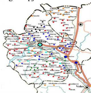
Abb. 1: Der Kreis von Skopje 3

Die Region von Skopje bildet auf der Podvardarska einen eigenen Talkessel, der auf allen Seiten durch hohe Berge von den umliegenden Regionen isoliert wird: Kitka im Südosten, Žeden und Voden im Süden und Karadak im Westen und Norden. Durch die Schlucht Derven im Westen und durch das Tal des Flusses Lepenca im Norden bestehen wenige geographische Verbindungen zu Tetovo und Kačanik. Außer der schon beschriebenen Stadt gehören noch Derven i Poshtëm im nordwestlichen Vardar-Tal, die Berggegend des Karadak (maz. Skopska Crna Gora, alb. Mali i Zi i Shkupit) im Norden sowie die Berggegend von Karshiaka im Süden entlang an den Bergen Žeden und Voden als eigenständige geographische Einheiten zum Kreis von Skopje, da für sie der Markt in Skopje zugänglich war und auch heute administrativ zu Skopje gehören. Die Gemeinde Haračinë wird seit einem Jahrzehnt durch die Ausdehnung Skopjes in seinen Bann gezogen.