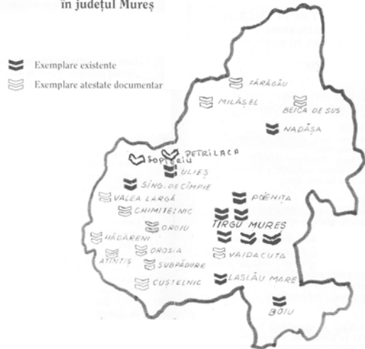
PREZENȚA ȘI CIRCULAȚIA NOULUI TESTAMENT DE LA BĂLGARAD în județul Mureș

Petrilaca. 21 În 1865-1867 exista la parohie, fiind inclusă în lista cărților și periodicelor trimise Mitropoliei de la Blaj.