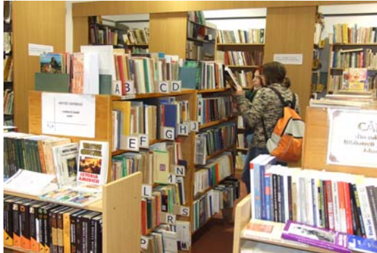
Biblioteca Județeană Mureș