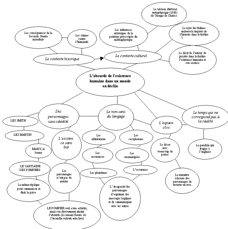
Figure 2. Le schéma obtenu suite à l'application du clustering