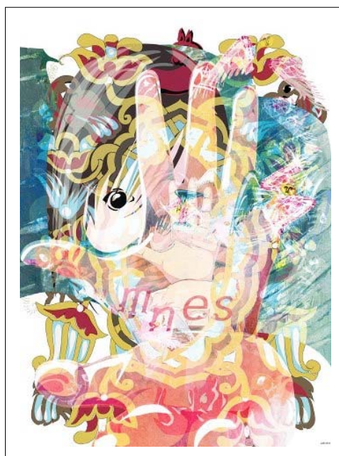
Fig. 4. Omnes , travail digital (auteure: Ana-Maria Ovadiuc, INFO ART USV, no. 4, mai 2013, p.11)