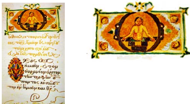
Fig. 2. Page illustrée avec frontispice (le manuscrit Liturgie du Saint Jean Chrysostome , 1620 – Musée National d'Art de Roumanie)

Les lettres Δ, Θ, Α, Κ et Τ résonnent avec l'espace culturel et religieux, ayant des formes et des motifs décoratifs rares. Tout en étudiant le rapport entre la forme et le contenu, on identifie la présence de la lettre Thetha Θ qui symbolise la mort, selon le nom du dieu Thanathos 1 .