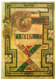
Fig.1. Page illustrée avec la lettre X, dans la Bible de Kells (Dublin, Irlande)

«La référence à Chi dans ces contextes représentationnels réitère le sens que non seulement la première lettre du nom de Christ était significative, mais tout particulièrement le visage et la position du corps, sa mort et, en même temps, sa nature cosmique» (Ben C. Thilghman).