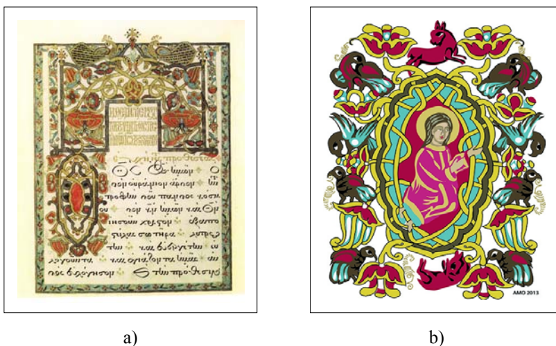
Fig. 3. a) Page de manuscrit; b) Illustration de la lettre O, interprétation digitalisée vectorisée, d'après le manuscrit 23, auteur le hiéromoine Calinic, La Liturgie du Saint Jean Chrysostome (manuscrit de Constantin Brâncoveanu, Musée National d'Art de Roumanie)

«Le frontispice de la page de titre de la liturgie de Saint Jean Chrysostome a la forme d'un portique dont l'ouverture rectangulaire est encadré dans le titre de la liturgie, la partie supérieure étant marquée par une accolade polylobée. Dans le champ du frontispice, différentes maillages englobent des motifs floraux stylisés (des pivoines etc.) Les fanes continuent au centre de la partie supérieure du frontispice avec deux têtes de serpent (en christianisme, symbole ambivalent) 4 , ayant un petit quadrupède au-dessus, pareil à une biche (possible image de la pureté), encadré par deux paons mis face à face (symboles de l'immortalité). Toute la composition est marquée par une croix, deux autres croix délimitant les deux parties du frontispice. Les couleurs dominantes sont le rouge, le bordeaux et l'or avec des accents verts» (R. Vulcănescu, 1985: 163).