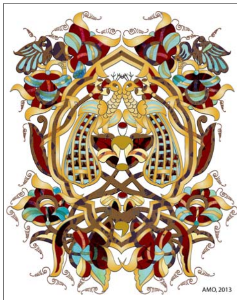
Fig. 5. Illustration de la lettre O (interprétation digitalisée d'après le manuscrit 23, auteur le hiéromoine Calinic, La Liturgie du Saint Jean Chrysostome – manuscrit de Constantin Brâncoveanu, Musée National d' Art de Roumanie)