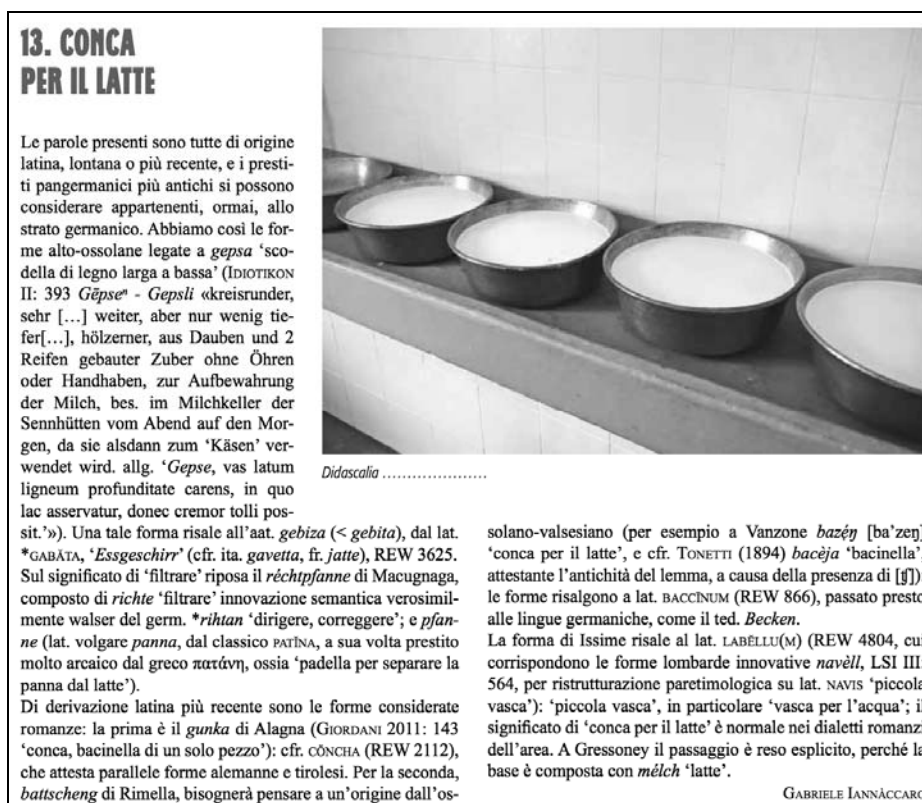
Fig. 3. Didascalìa di CONCA PER IL LATTE (PALWaM 2015: 92).

Ora, a partire dai 45 concetti presi in considerazione per questo atlante in formato cartaceo (ben di più sono disponibili nella banca dati) si sono elicitati 380 tipi lessicali distribuiti sulle otto comunità che hanno fatto parte del progetto. Va tenuto presente che la distribuzione non è del tutto omogenea, proprio perché per alcuni concetti alcuni parlanti hanno offerto più di un tipo lessicale (ad esempio riferendosi ad oggetti più specifici rientranti nella stessa sfera semantica), mentre in altri casi gli informatori non hanno saputo fornire alcun termine nella parlata walser locale. Di questi 380 tipi lessicali, 67 (circa uno su cinque) sono stati classificati come romanzi, ovvero come prestiti entrati nel patrimonio lessicale walser in epoca successiva alla migrazione (cfr. nota 15), per contatto con le popolazioni circostanti e con le lingue-tetto che si sono radicate nel corso del tempo (italiano e francese). Ovviamente questi 67 tipi lessicali di origine romanza non sono distribuiti uniformemente nella banca dati, né in termini di varietà dialettali, né in termini di significati: sono proprio queste asimmetrie a risultare particolarmente interessanti per indagare i diversi gradi di permeabilità del lessico ad influenze esterne (o viceversa, i diversi gradi di resistenza) nell'ambito delle parlate minoritarie.