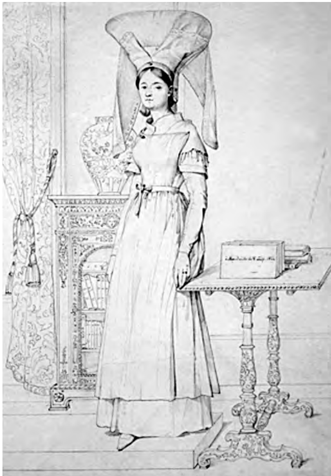
INGRES Femeie în costum specific regiunii Caen